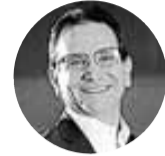
Juan Carlos Mora Presidente de Grupo Bancolombia

Una vez aprobado, se enviará un prospecto final a los accionistas de Bancolombia en Estados Unidos.